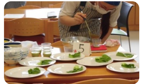
慣れないと計るのは大変です。