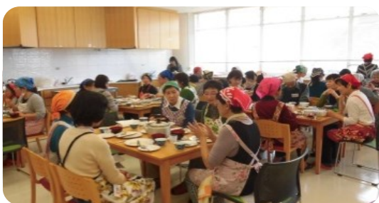
一番楽しいひとときを！！