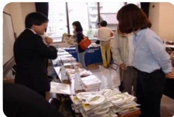
メーカーさんの協力