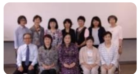
福田先生 理事長 協力者 スタッフ