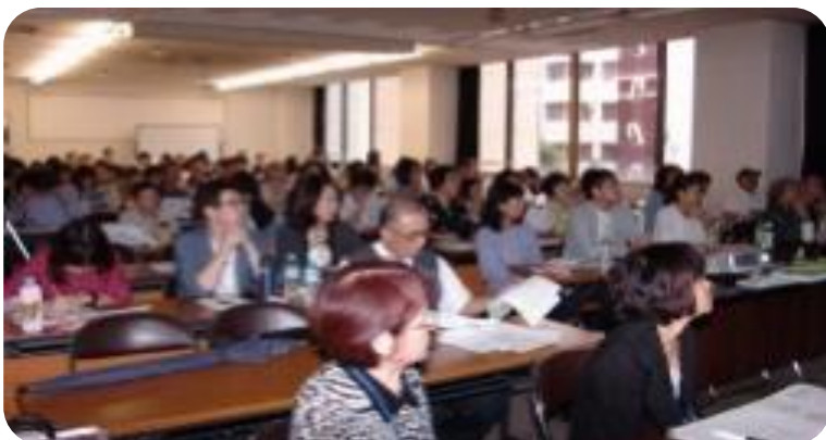
10:00～16:00 講演 患者経験談 質疑応答