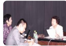
夫の協力者 妻の立場から