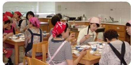
苦労話や情報交換で楽しい時間！！