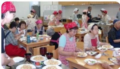
食事はテーブル毎に・・・戴きま～す