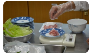
自分の分は自分で計ります