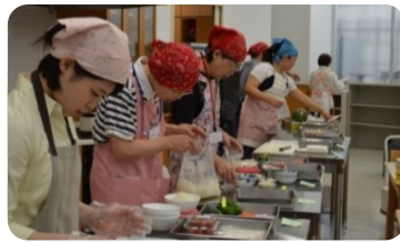
学生さんと近隣の栄養士も下準備中