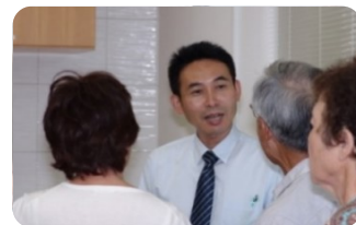
質問が相次いでいます。