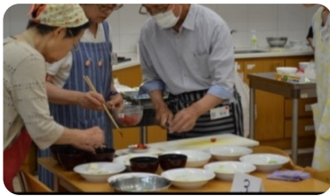
奥様のお手伝いのもと奮闘中...