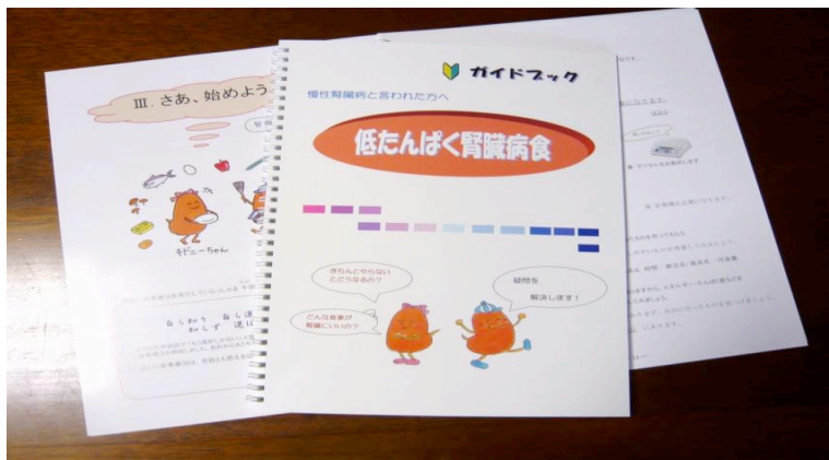
[ 見やすいリング綴じ A4 42ページ ]

高血圧・糖尿病・脂質異常症(高脂血症)などの生活習慣病があると、腎機能が低下し、心筋梗塞や脳卒中などの生命にかかわる病気につながる可能性があります。生活をおびやかす新たな「国民病」です。